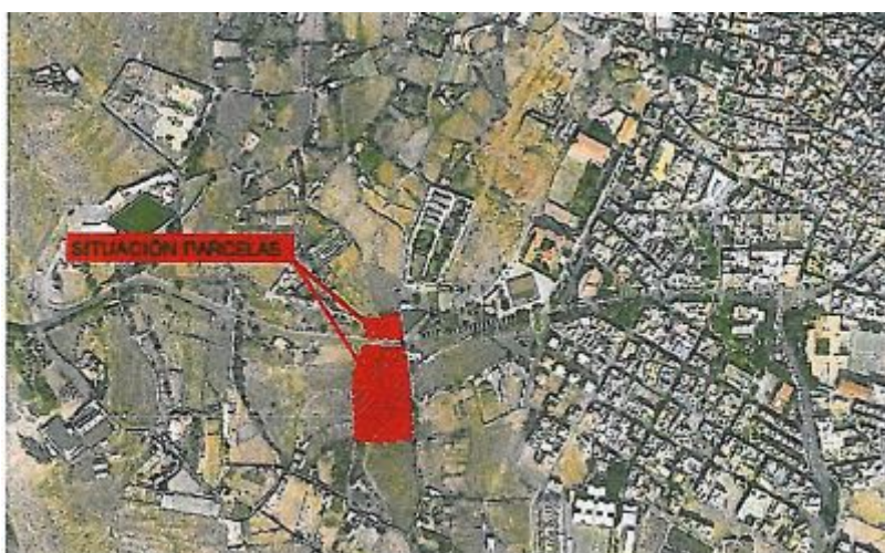
Situación de las parcelas respecto al caso de Agüimes