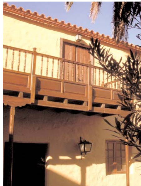
Casa de Betania